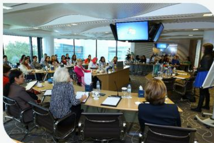
Internationally renowned speaker shares five brain and behavior fixes with members.